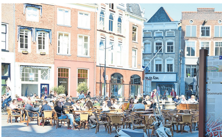
Meer bezoekers maakt dat de stad leefbaarder wordt.

Wat maakt Zutphen zo bijzonder? "Zutphen heeft een uniek winke-